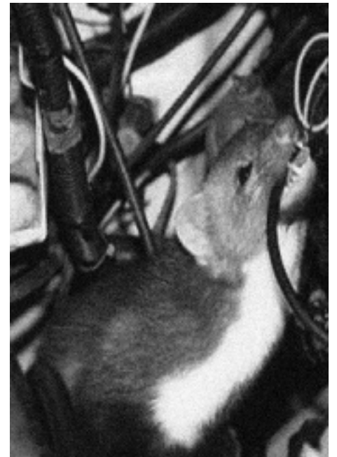
Bild: Hier will sich ein vermeintlich „harmloser“ Steinmarder durchbeissen.