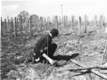
Bild: Dipl. Biologe Novak bei der Begutachtung typischer Wühlmausverbisse.

Bitte stellen Sie sich vor. Wie ist ihre wissenschaftliche Reputation? Wieso Wühlmäuse?