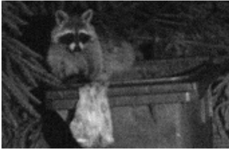
Bild: Der scheue Herr Lotor hat es sich nach erfolgreichem Beutezug auf seinem Bett gemütlich gemacht. Guten Appetit!

Der mittlerweile 35jährige Waschbär war zeit seiner Mitgliedschaft bei der Hamburger Grindcoreband „Attack of the mad Axeman“ für die Entstehung derbster Grindcorehits zuständig und kreierte hammerharte Slashersongs wie beispielsweise „Evolution needed“ und „The French & The Frosch“. Der Waschbär ist nun aus dem aktiven Musikerleben ausgetreten und tut sich seit einiger Zeit ausschliesslich als vielseitig interessierter Konzertbesucher in der