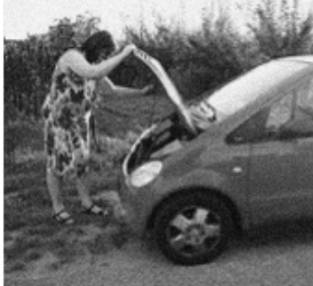
Bild: Stillgelegt!!! Fassungslos blickt eine Dame auf die Beschädigung.

Kabelbeisser haben in der Nacht zum Mittwoch eine Spur der Verwüstung durch Hamburg gezogen. In Hamm, Winterhude, Fuhsbüttel und Langenhorn gingen mindestens elf Autos der Strom aus. Drei weitere wurden ebenfalls beschädigt. Auch in Norderstedt wurden zwei Fahrzeuge angebissen. Eine solche Serie gab es in Hamburg noch nie.