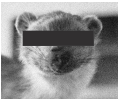
Bild: Möchte lieber anonym bleiben: ein Mitglied der Marderbande.

Das ist schwer zu sagen. Autos bleiben eben Autos, auch wenn sie von Sympathisanten gelenkt werden. Aber wir versuchen natürlich darauf zu achten, eher die Wagen anzugreifen, von denen die größere Gefahr ausgeht. Natürlich trifft es hin und wieder mal die "Falschen", wenn man das im Zusammenhang mit Autofahrern überhaupt sagen kann.