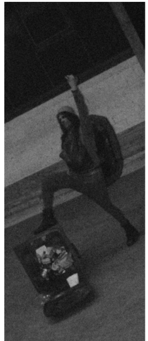
Bild: Unser Bild zeigt Prä-Messias Orbicularis, abgelichtet bei einer seiner berüchtigten Hasspredigten, hier im Skatepark Karlsruhe.

Inhaltlich ist natürlich noch nicht viel darüber zu sagen, aber besser als Odin, Satan, Gott oder Allah wird das auf jeden Fall. Soviel steht jetzt schon fest. Sollten sie Fragen über Spendenkonten haben oder ihre Vorstellung ihrer neuen Glaubensrichtung einreichen wollen, wenden sie sich vertrauensvoll an: turtle@animalgrind.org