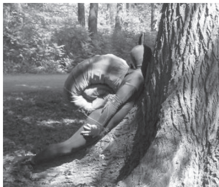
Bild: Helix Pomatia in Rumänien.