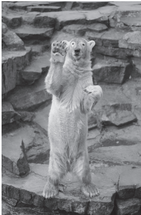
Bild: Unser Bild zeigt den kleinen Eisbären Knut in seinem Gehege im Zoo von Berlin.

Die Welt ist fassungslos. Erdbeben, Tsunami und Atomscheisse in Japan, Krieg in Libyen, Trainerkarussell in der Bundesliga - drauf geschissen. Am Samstag, den 19. März 2011 ist Knut im Berliner Zoo tot umgefallen, einfach so. Dabei fing der Tag so gut an: Kaiserwetter, 700 Leute am Gehege, Knut posierte gegen den drohenden Klimawandel. Doch dann fing er plötzlich an, unkontrolliert rumzuhumpeln und klatschte schließlich ins Schwimmbecken. Arschbombe? Bauchplatscher? Nichts dergleichen. Regungslos blieb er im Wasser liegen und war tot.