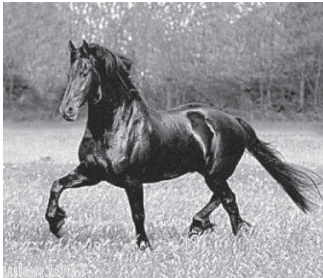
Bild: Archivbild aus dem Jahr 1994. Black Beauty geht es gut. Dann schlägt Schockemöhle zu.

Black Beauty, der gefeierte Serienstar der Siebziger Jahre ist schon seit langem aus dem Showbiz verschwunden. Nach einem missglückten Comeback in Australien Mitte der Neunziger wurde das Pferd für einen Spottpreis an den angesehenen Pferdeschinder Paul Schockemöhle verkauft. Dieser versuchte allen Ernstes, Black Beauty zu den Olympischen Spielen 1996 in der Disziplin Springreiten anzumelden. Der ehemals stolze schwarze Hengst war allerdings gebarrt bis zum Anschlag und randvoll mit sogenanntem "Kraftfutter". Daher wurde Black Beauty noch vor Beginn der Spiele von der Anti-Dopingkommission aus dem Verkehr gezogen. Nach außen hin behauptete Schockemöhle allerdings, Black Beauty wäre von einer Hamburger Entführerbande in die Luft gesprengt worden, nachdem deren Forderungen nicht erfüllt worden waren. Heute haust Black Beauty im schäbigsten Stall auf Gut Lewitz, muss auf schmutzigem Streu schlafen und kaut an einem vertrockneten, alten Gnadenbrot.