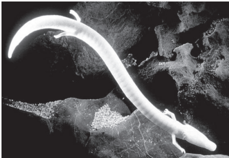
Bild: Das Bild zeigt einen Olm. Der Olm befindet sich in einer auf dem Bauch liegenden Position und verhält sich zunächst abwartend.

An dieser Stelle wirft die GramS - Redaktion einen Blick über den menschenzentrierten Tellerrand und wird den geneigten Leserinnen & Lesern einen ebenso einfachen wie faszinierenden Zeitgenossen vorstellen. Der scheue Höhlenbewohner wäre sowohl aufgrund seines - auf die meisten Säugetiere äußerst abstoßend wirkenden - Äußeren als auch wegen der auf ein Minimum reduzierten Lebensweise für die engere Auswahl zum „Untier des Jahres 2011“ prädestiniert. GramS checkt für Euch welches Lebensmotto sich der Grottenolm wohl ausgesucht haben könnte: Hear Nothing, See Nothing, Say Nothing ..oder: You`ll never see Heaven? Eine Reportage von Wald- und Wisenreporter Bubo Bubo.