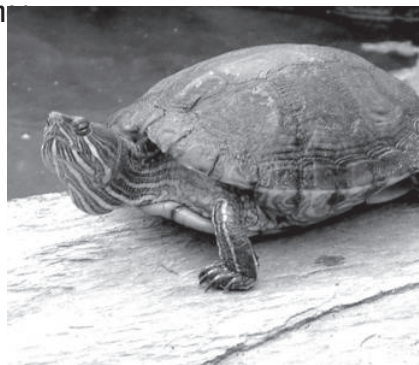
Bild: Emys Orbicularis überlegt, was in seinem neuen Testament so alles drinstehen soll.

(Whi) In der letzten Ausgabe der GramS veröffentlichten wir unter dem Titel „Brauchen wir einen neuen Messias?“ Auszüge eines Interviews mit dem Grindcore-Prediger Emys Orbicularis. Er stellte dort die Grundpfeiler seiner neuen Religion vor, die im wesentlichen darauf basierten, dass man sich die Inhalte eben jener nahezu frei auswählen könne. Unlängst erreichte uns eine Mitteilung von höchster Stelle, in welcher Orbicularis selbst erklärt, dass das Projekt sich in einer Umstrukturierungsphase befinde. Aufgrund der in den Augen der Schildkröte zu geringen Resonanz auf den GramS-Artikel müsse davon ausgegangen werden, dass die Welt noch nicht bereit sei für einen Glauben dessen Inhalte sie frei wählen könne. Als Konsequenz daraus hat Orbicularis sich entschlossen, sein Konzept etwas an die etablierten Glaubensrichtungen anzupassen und begonnen eine Art neues Neues Testament zu verfassen, welches nach Fertigstellung unter dem Titel „Kein Panzer ist so hart wie das Leben“ in den Handel kommen soll. Desweiteren wird er in unregelmäßigen Abständen online Texte veröffentlichen um den Leuten seine Sicht der Dinge etwas näher zu bringen. Genauere Informationen werden Interessierte in Kürze über die MySpace Seite der Band „Attack of the mad Axeman“ in Erfahrung bringen können.